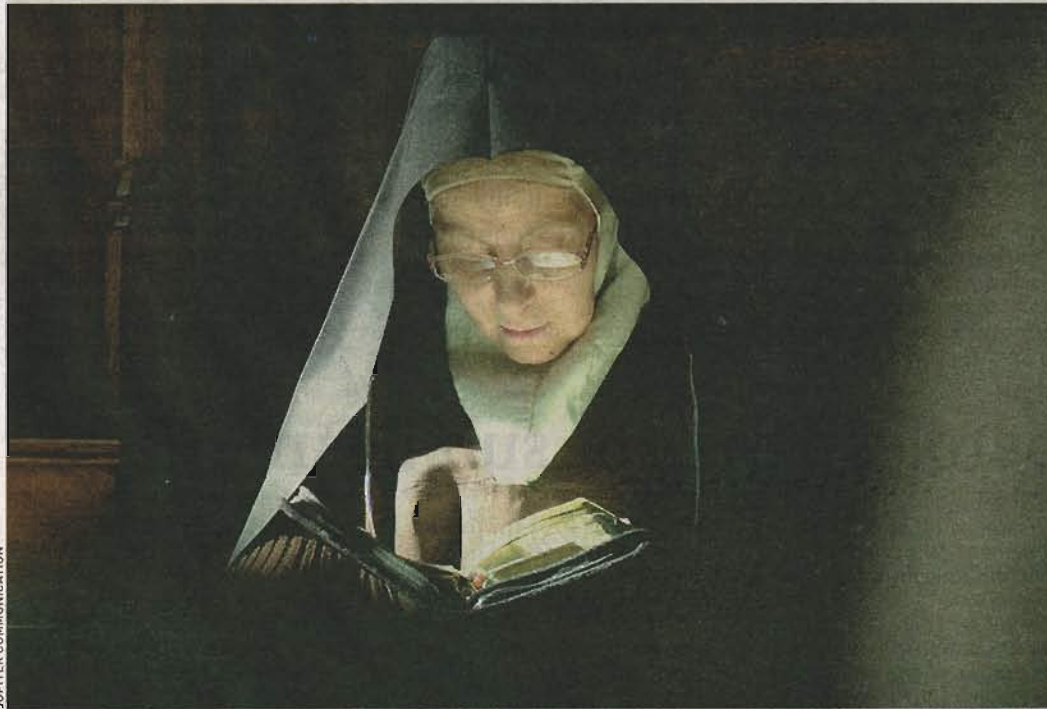
JAMIS INTRUSIF, PROFONDEMENT À L'ÉCOUTE, le cinéaste fait sentir la densité de la vie intérieure de ces religieuses.